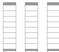
3 x HVM+ 22.1