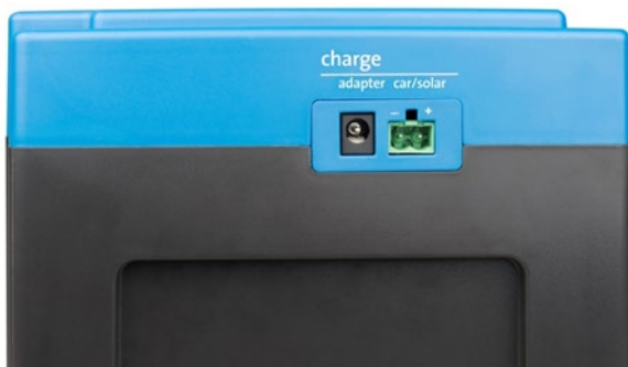
Adaptador y entradas coche/solar (toma para entrada de coche/solar incluida)