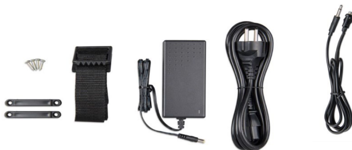
Correa de fijación Adaptador Cable de alimentación Pulsador con cable (2m) y LED bicolor