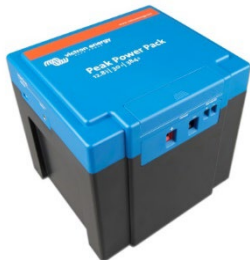
12,8 V, 30Ah