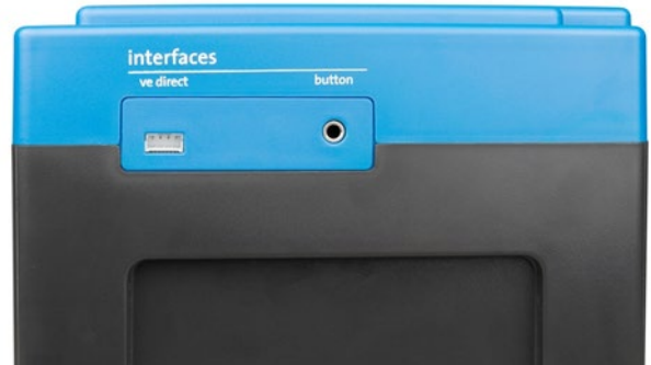
VE.Direct y pulsador