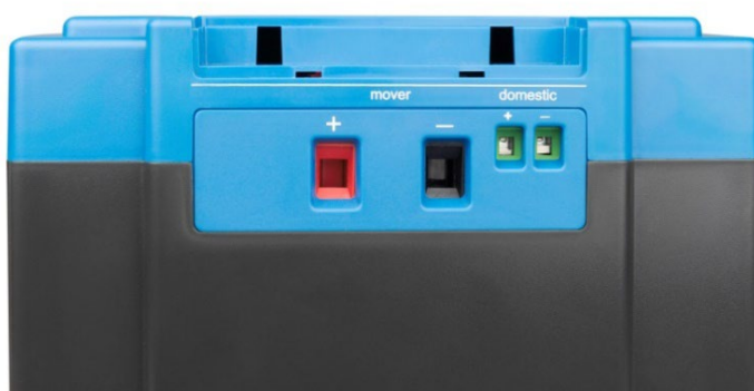
Salida de alta capacidad (mover) y salida de baja capacidad