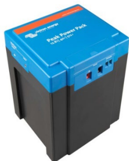
12,8 V, 40Ah