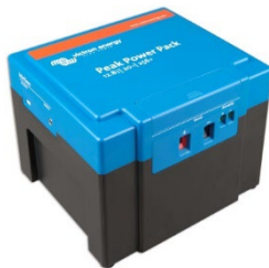
12,8 V, 20Ah