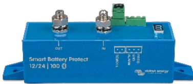
Smart BatteryProtect BP-100