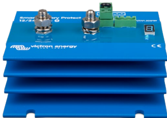
Smart BatteryProtect BP-220