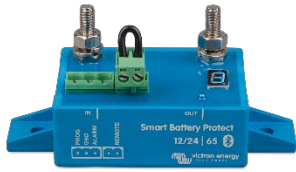
Smart BatteryProtect BP-65